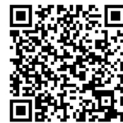
サイト QR コード

※「i-mode/i モード」、「i アプリ」、「きせかえツール」は株式会社エヌ・ティ・ティ・ドコモのサービス名称、商標または登録商標です。 ※「QR コード」は株式会社デンソーウェブの登録商標です。 ※記載されている会社名および商品名/サービス名は各社の商標または登録商標です。